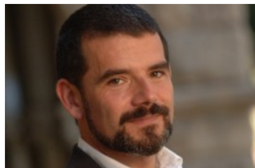
Lessing: "As facções no Brasil são algumas das mais sofisticadas organizações criminosas que existem no mundo"

Para o pesquisador, o projeto de lei anticrime de Moro não deverá resolver o problema da violência de gangues no Brasil. Isso porque as duas principais medidas relacionadas à segurança pública - a que possibilita reduzir ou extinguir a pena de agente de segurança que agir em excesso e a que estende a permanência de presos no sistema federal para até três anos, renováveis - já estariam em vigor na prática, sem enfraquecer as grandes facções.