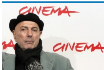
Babenco foi o primeiro latino-americano a receber indicação ao Oscar de diretor

Três anos mais tarde, igualmente indicados foram os intérpretes de "Ironweed", Jack Nicholson e Meryl Streep. Não venceram, mas estão entre as maiores e mais originais de suas carreiras as performances como dois